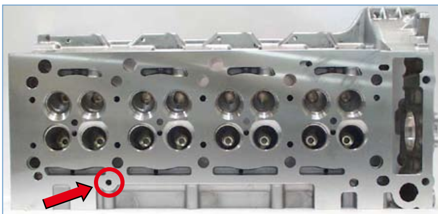
Abb. 1 Wasserkanal am Zylinderkopf, der eventuell mit einer Kugel verschlossen wird