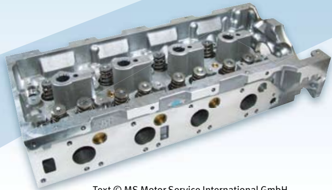
Text © MS Motor Service International GmbH

Achtung, für die unten aufgeführten Motorbaureihen gibt es Zylinderköpfe, bei denen der Wasserkanal durch eine Kugel verschlossen ist.