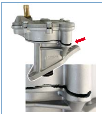
Abb. 1 Bruch im Pumpengehäuse

Bitte beachten Sie die Einbauhinweise des Herstellers.