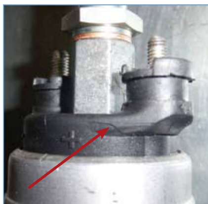
Abb. 2 Pumpenkörper im Bereich der elektrischen Anschlüsse auf Grund von Gewalteinwirkung gebrochen