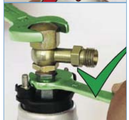
Abb. 3 falsche/richtige Montage der Kraftstoffpumpe