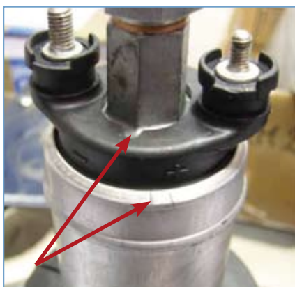
Abb. 1 Pumpenkörper im Gehäuse verdreht, Markierungen gegeneinander verdreht

Kraftstoffpumpen finden Sie im MSD-Online-Katalog: http://onlineshop.ms-motor-service.de