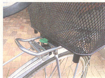
Eingerastet: Der Racktime-Korb

Damenrad wahrgenommen. Tatsächlich macht die „Wave konvex“ benannte Form des Rahmens aus Aluminium 7005 (Höhen 50 und 55 Zentimeter) das Rad für jeden interessant, der einen tieferen Durchstieg mag: Das massive Unterrohr ist nicht zum Tretlager, sondern zum Sitzrohr geführt, von wo aus es sich als drittes Hinterbaustreben-Paar fortsetzt. Oberhalb vom Tretlager treffen sich mit ihm die Oberrohre zu einem stabilisierenden Dreieck. Das macht den Rahmen wesentlich steifer, als man ihn vom Ansehen her erwartet. Außerdem bildet das Rohr-Dreieck einen idealen Handgriff: Man hebt das – unbeladene – Fahrrad genau im Schwerpunkt an.