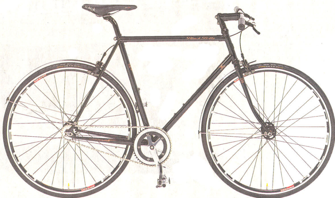
Black Beauty sollte das Modell „Black Betty“ heißen: Bei diesem verkappten Renner geht es um Leichtigkeit und Aussehen

Zwei ganz unterschiedliche Räder aus dem Programm wurden erprobt: Das „Parera“ wird auf den ersten Blick als