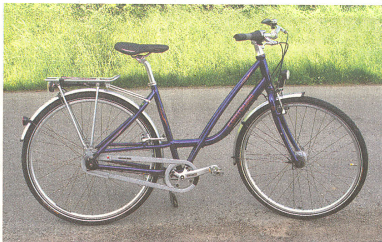
Stabil mit tiefem Durchstieg: Das „Contoura Parera“ ist ein bequemes Alltagsrad