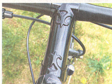
„Zierat“: Vorbau am Black Betty