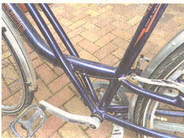
Triangel: Versteifung und Handgriff